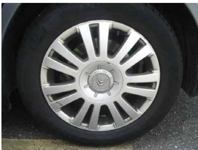
Acceptabel (velg beschadiging buitenste rand tot max. 10cm)