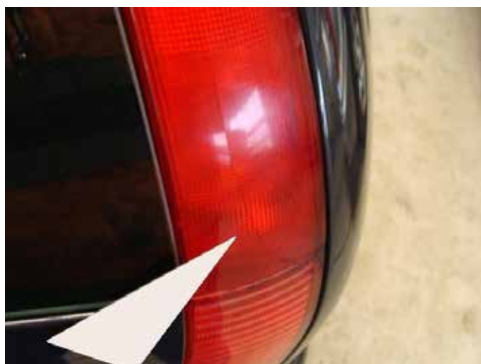
Niet acceptabel (barst in de lichtunit)