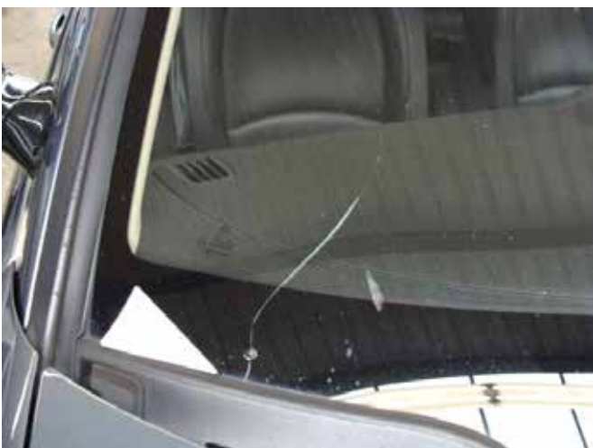
Niet acceptabel (sterretje uitgelopen in een barst)