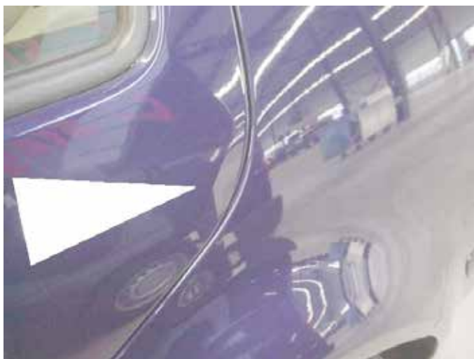
Niet acceptabel (portierrand gevouwen)