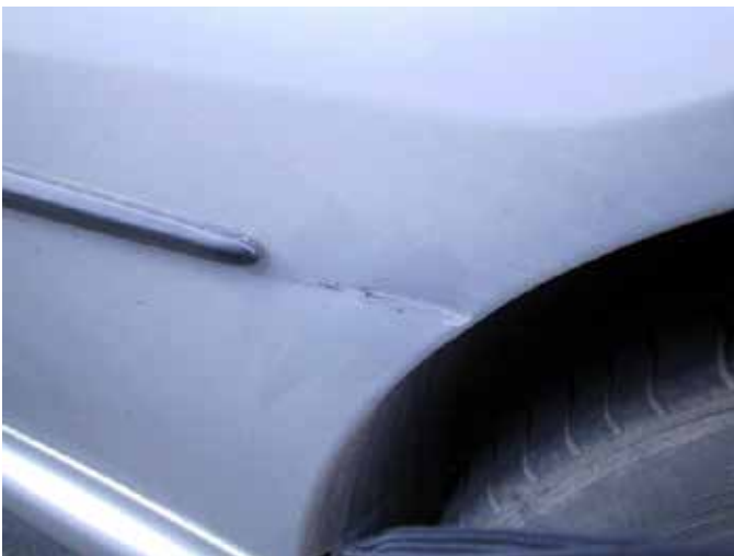
Niet acceptabel (gleedeuk)