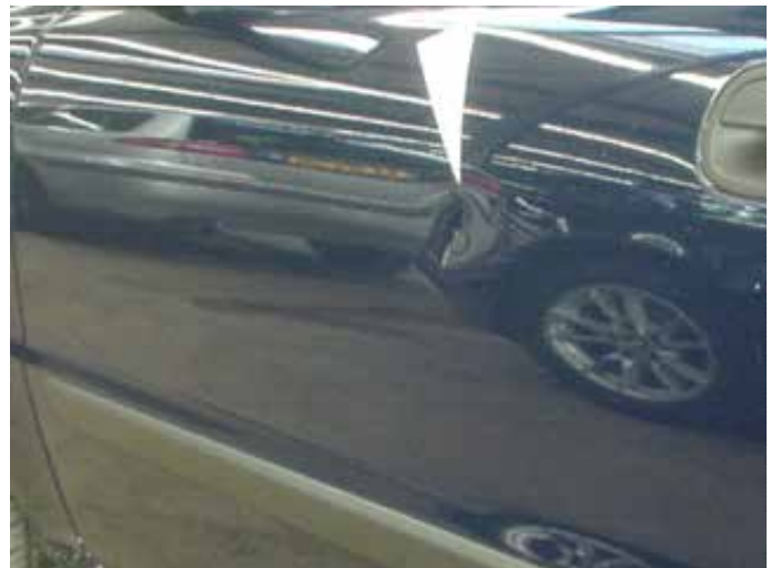
Niet acceptabel (deukje gevouwen)