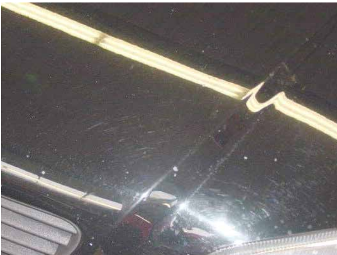
Acceptabel (>75.000 kilometer)