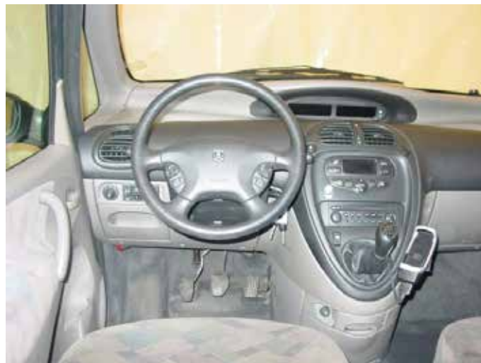
Acceptabel (carkit blijft gemonteerd, gaten niet zichtbaar)