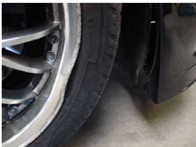
Niet acceptabel (velg gedeukt)