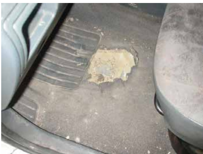
Niet acceptabel (gat in vloerbekleding)