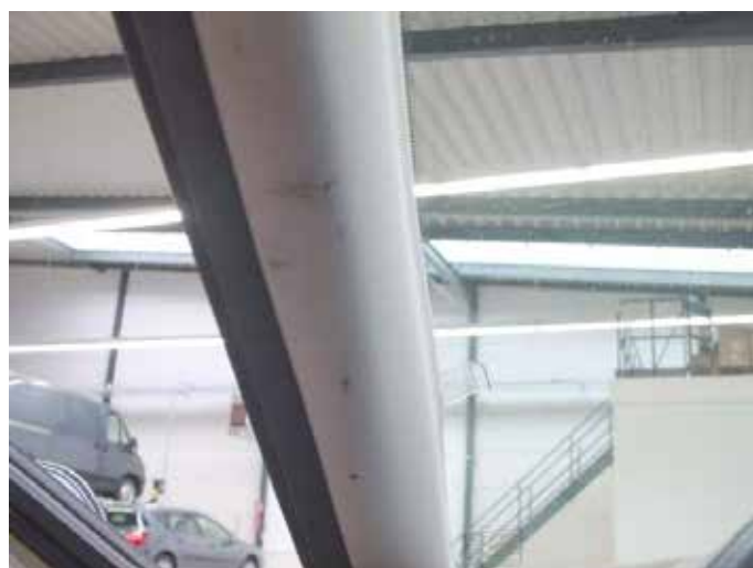
Niet acceptabel (brandplekjes raamstijl)