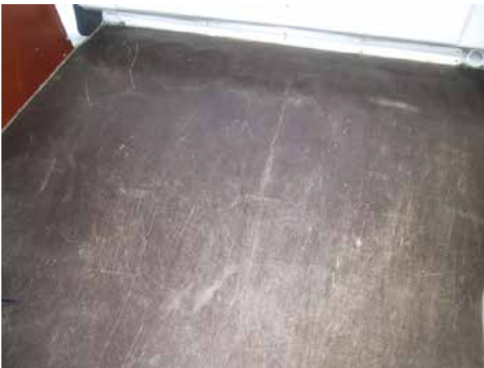
Acceptabel (lichte krasschade)