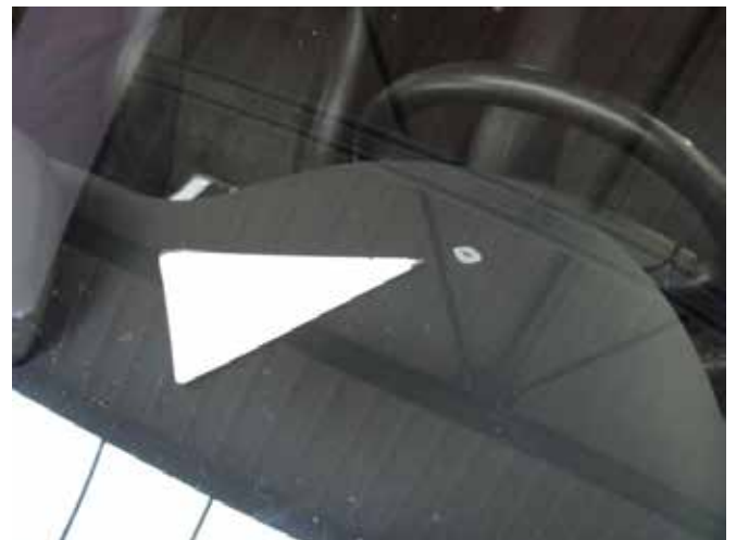
Niet acceptabel (tussenlaag warmtewerende ruit aangetast)