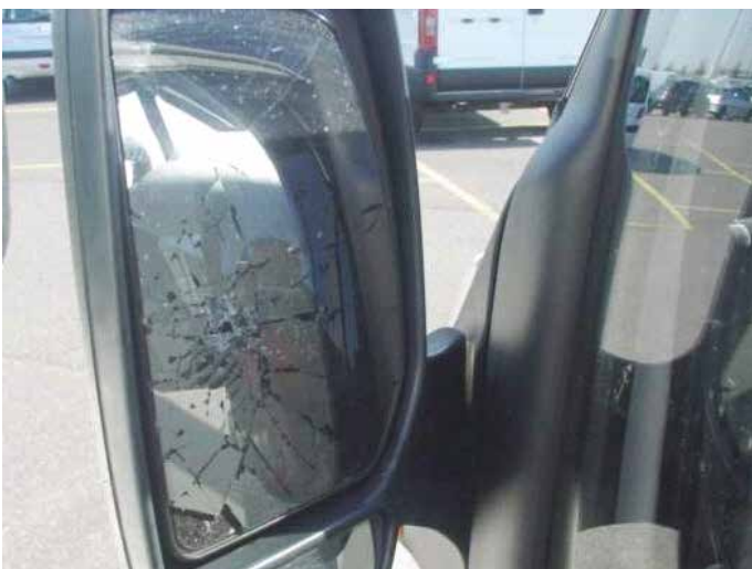
Niet acceptabel (spiegelglas gebarsten)