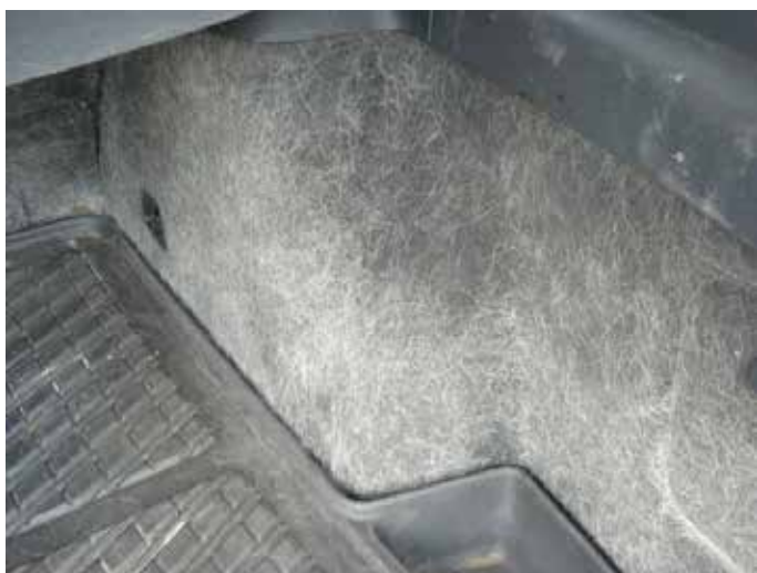
Niet acceptabel (ernstige vervuiling door hondenharen)

Als gevolg van gebruik kunnen delen lichte slijtage vertonen, denk hierbij bijvoorbeeld aan het stuurwiel. Het stuurwiel mag slijtage vertonen echter mogen er geen 'scheuren' of happen uit het kunststof / leder zijn. Vloerbekleding mag lichte slijtage vertonen, scheuren en gaten in vloerbekleding zijn niet acceptabel.