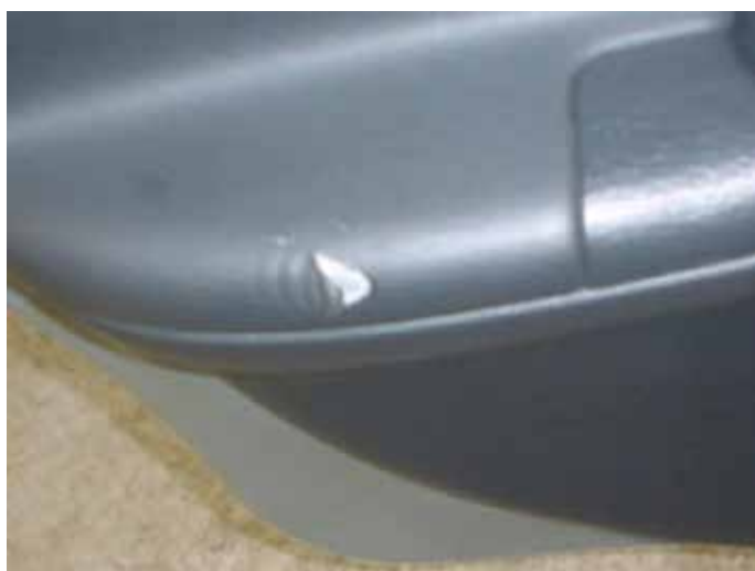
Niet acceptabel (scheur in bekleding deurpaneel)