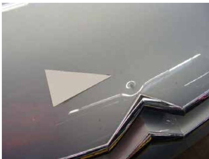
Niet acceptabel (deukje niet te modelleren)