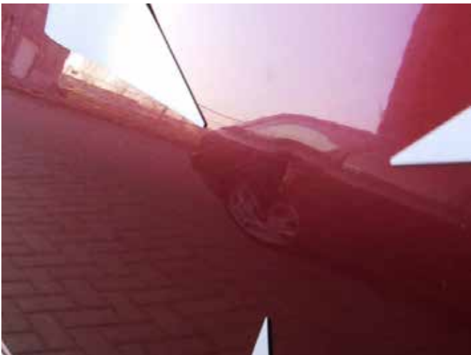
Acceptabel (maximaal 2 centimeter; niet gevouwen)