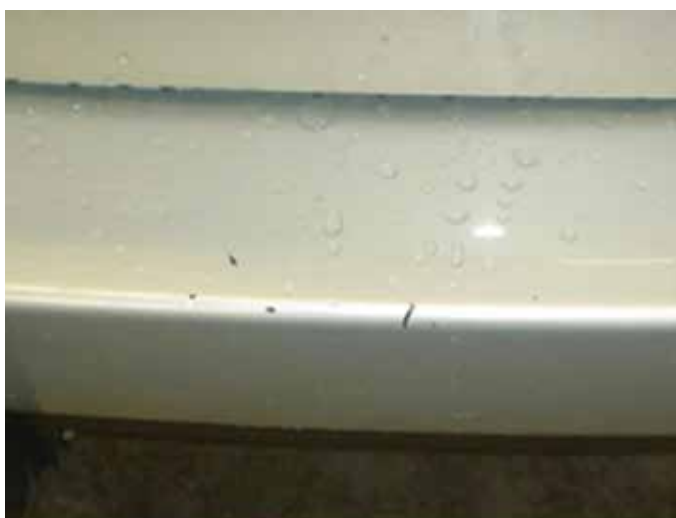
Acceptabel (maximaal 5 krasjes door de lak heen)