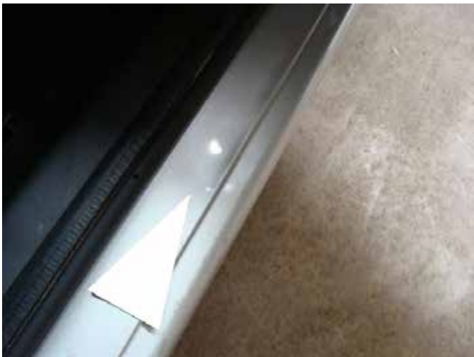
Niet acceptabel (dorpel gedeukt)