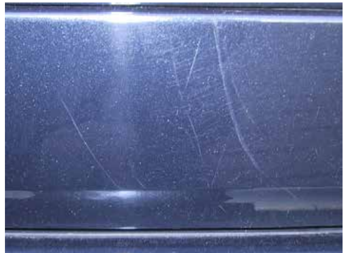
Acceptabel (oppervlakkige poetskrassen)