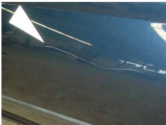
Niet acceptabel (kras door de lak heen)