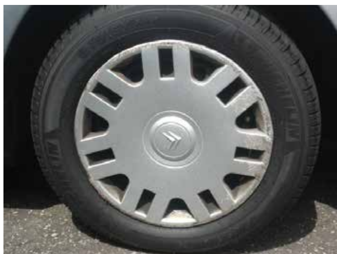
Niet acceptabel (beschadiging tot in het kunststof)