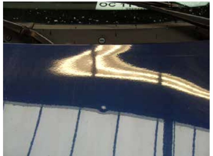
Acceptabel (één deukje te modelleren)