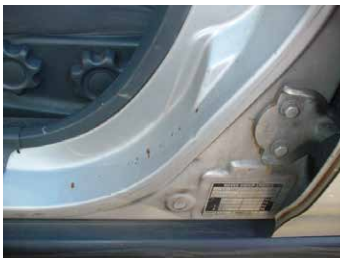
Niet acceptabel (sponning gedeukt/roestvorming)