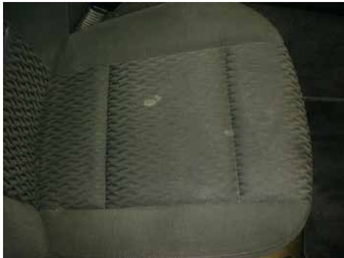
Acceptabel (vlekken verwijderbaar)