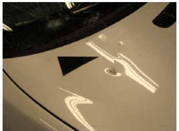
Niet acceptabel (molest; voorwerp op motorkap gegooid)