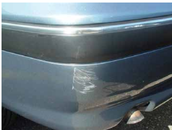
Niet acceptabel (beschadiging tot op de grondlak)