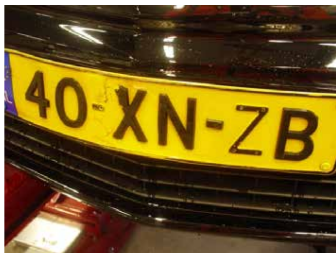
Niet acceptabel (luxe plaat; letters manco en gebroken)