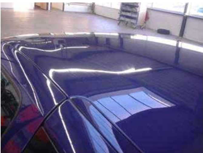
Niet acceptabel (molest; voetstappen op dak)