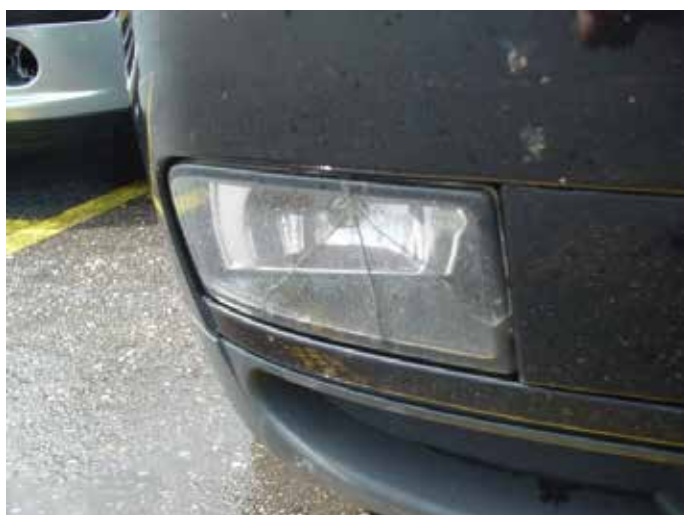
Niet acceptabel (scheur/barst in de lichtunit)