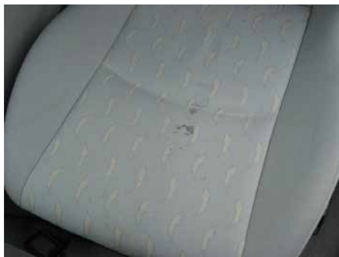
Niet acceptabel (vetvlekken)