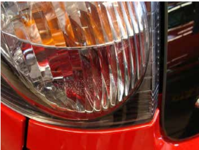
Acceptabel (haarscheurtjes van binnenuit)