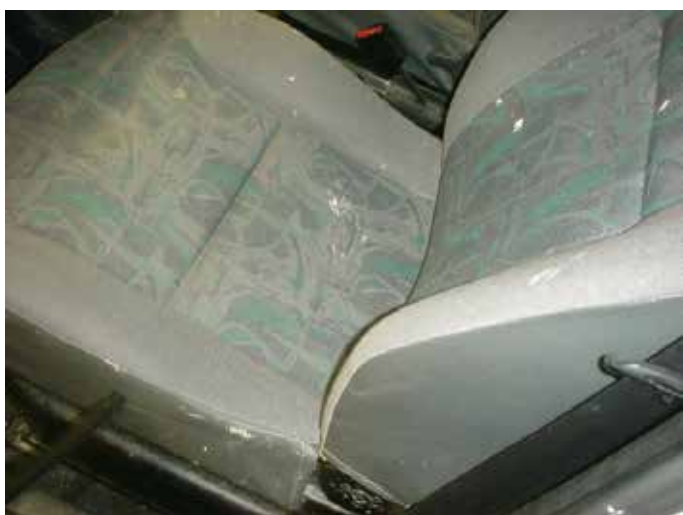
Niet acceptabel (verfvlekken)