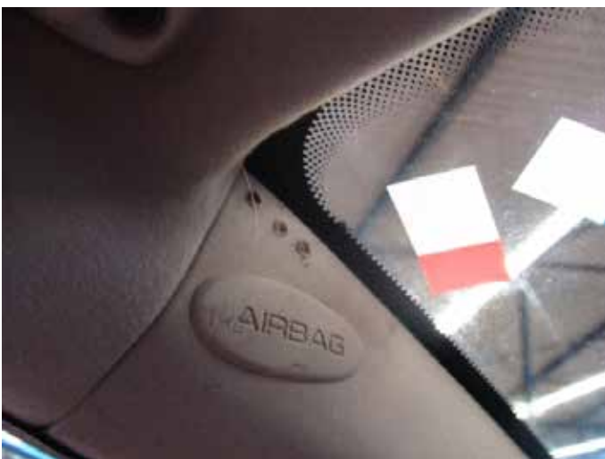
Niet acceptabel (microfoon gedemonteerd A-stijl)