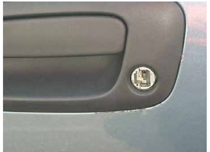
Niet acceptabel (niet gerepareerde inbraakschade)