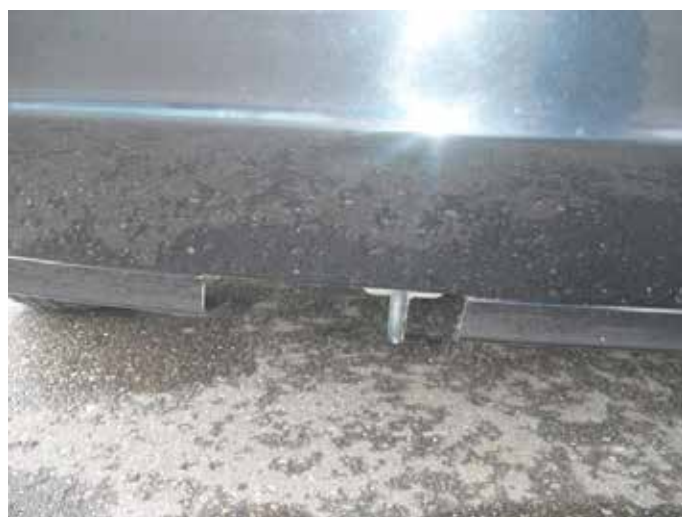
Niet acceptabel (uitsparing gedemonteerde trekhaak)