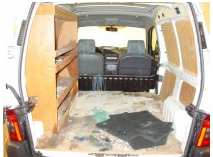
Acceptabel (verfvlekken op laadvloer)