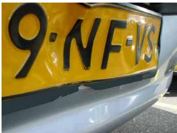
Niet acceptabel (kentekenplaat gedeukt)

Kentekenplaten mogen niet beschadigd of gebogen zijn. Bij luxe kentekenplaten mogen geen kunststofdelen van de letters en/of cijfers afgebroken zijn of missen.