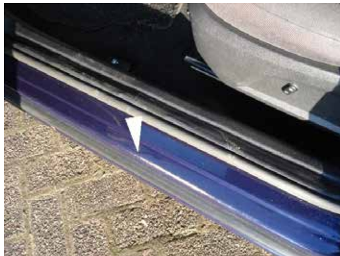
Acceptabel (lichte krasschade, niet door de lak heen)