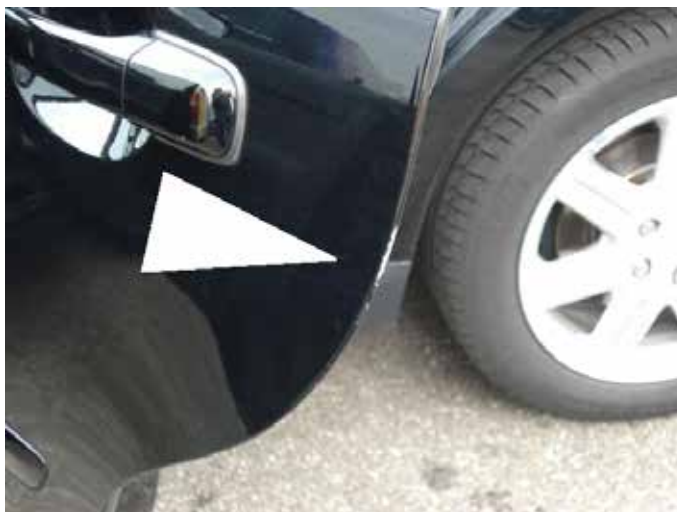
Acceptabel (lichte lakbeschadiging tot 10cm.)