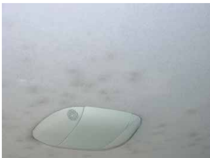
Niet acceptabel (meer dan 5 vervuilde plekjes)