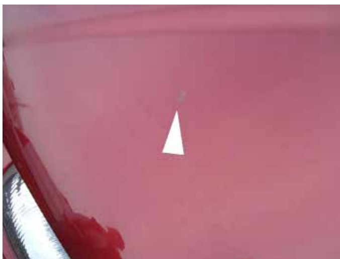
Acceptabel (vogelvuil; te poetsen/geen aantasting lak)