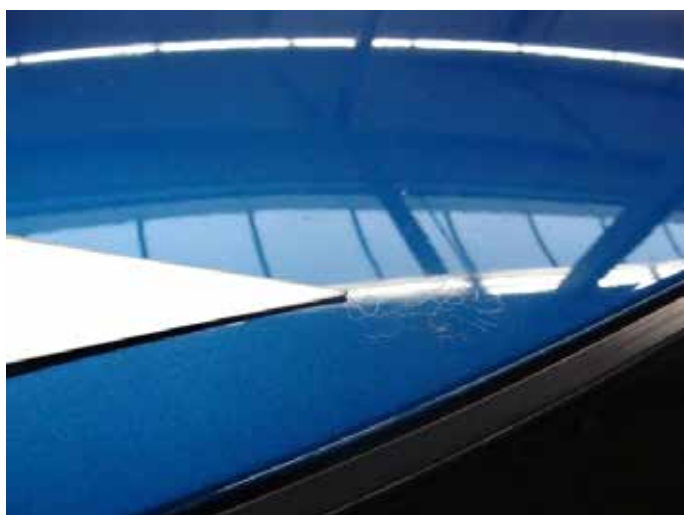
Niet acceptabel (vogelvuil; zichtbare aantasting)