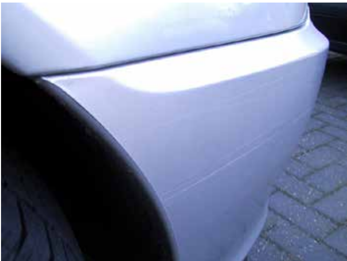
Acceptabel (lichte lakbeschadiging)