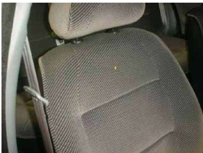
Niet acceptabel (brandgat in stoelbekleding)