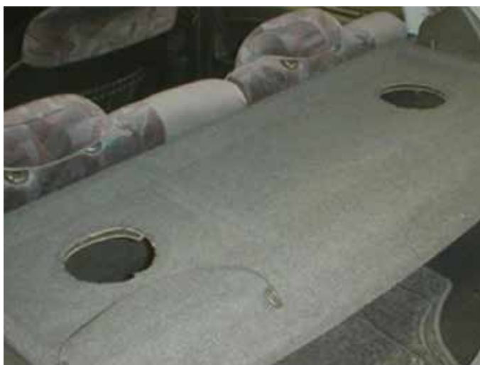
Niet acceptabel (speakers gedemonteerd)