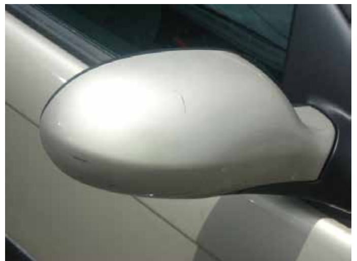
Niet acceptabel (krassen door de lak heen)