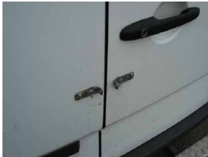
Niet acceptabel (sloten op het plaatwerk aangebracht)