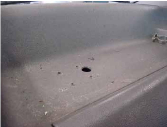
Niet acceptabel (doorvoergaten voor kabels)