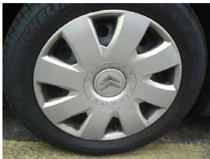
Acceptabel (lichte oppervlakkige schaafplek, max. 10cm)