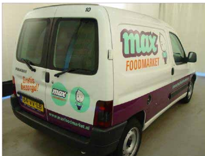
Niet acceptabel (bestickerd voertuig met reclame)