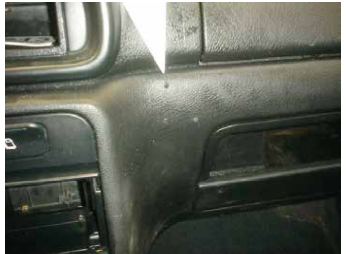
Niet acceptabel (gaten door gedemonteerde carkit)