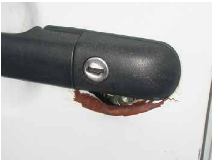
Niet acceptabel (niet gerepareerde inbraakschade)