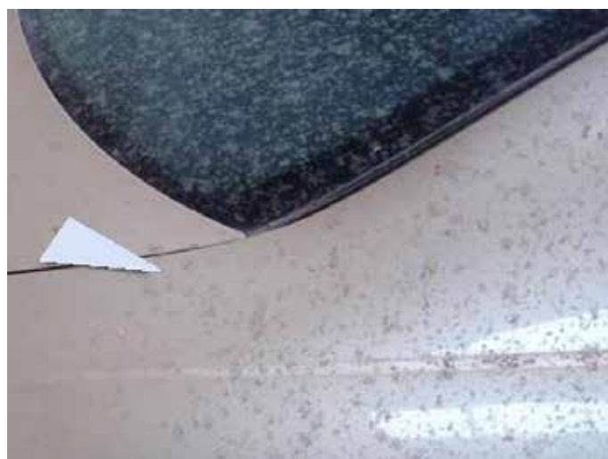
Niet acceptabel (chemie-inwerking; zichtbare aantasting)