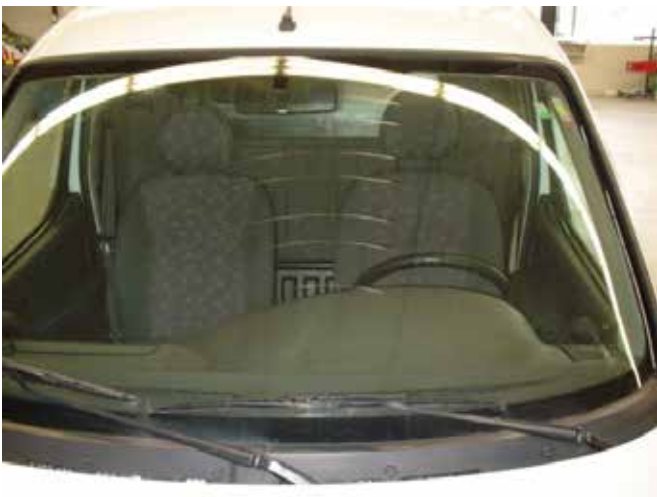
Niet acceptabel (krassen door ruitenwissers)