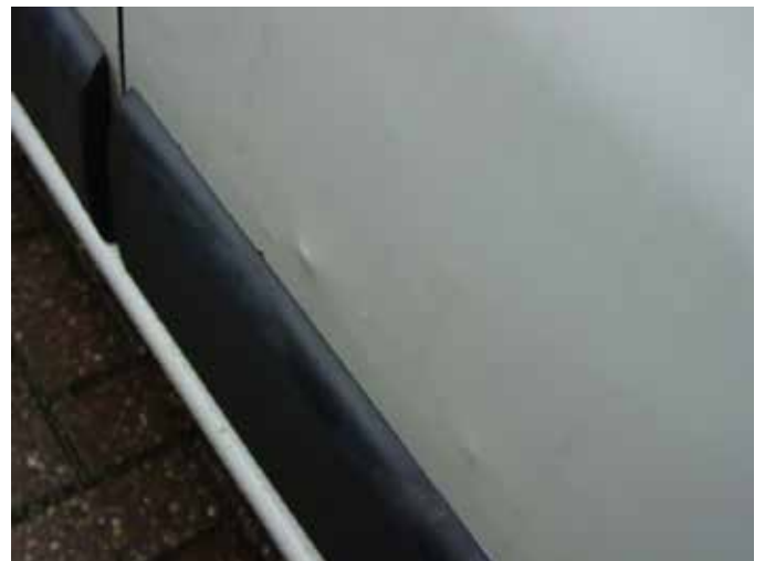
Niet acceptabel (deuken van binnen naar buiten)