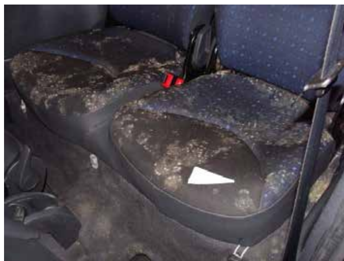
Niet acceptabel (schimmelvorming)