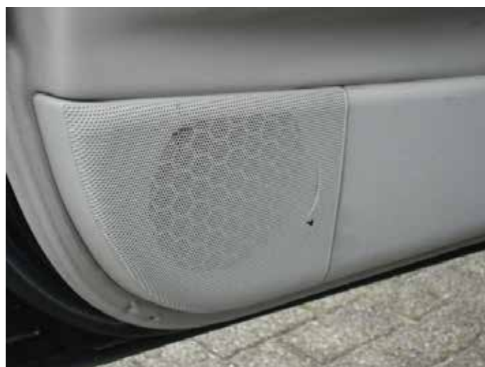
Niet acceptabel (scheuren in speakerkap)