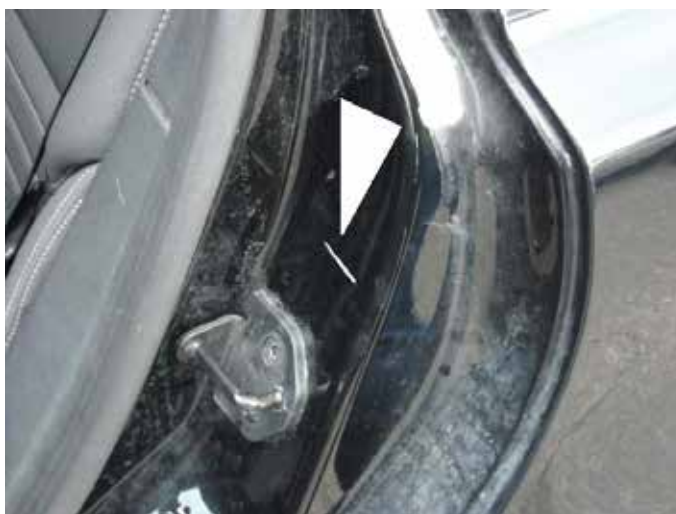
Acceptabel (krasje door de lak heen, geen roest/deukje)