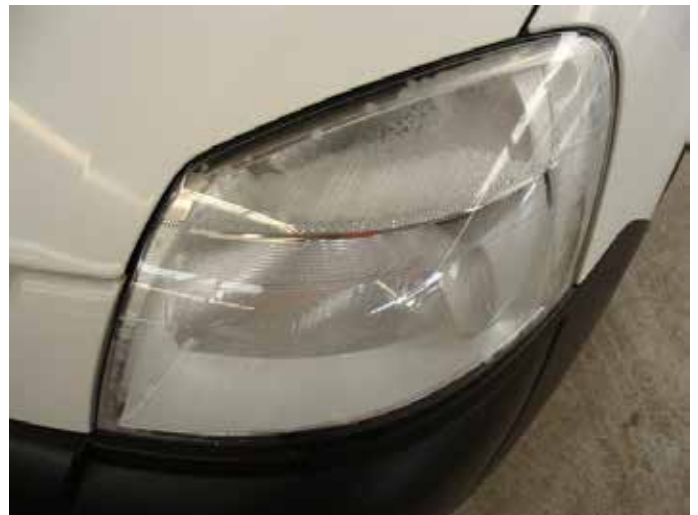
Acceptabel (condens in lichtunit; reflector niet aangetast)