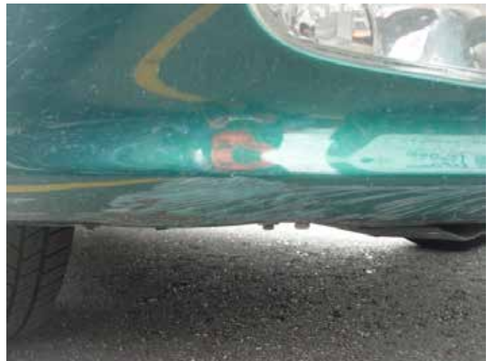
Acceptabel (onderzijde voorspoiler)